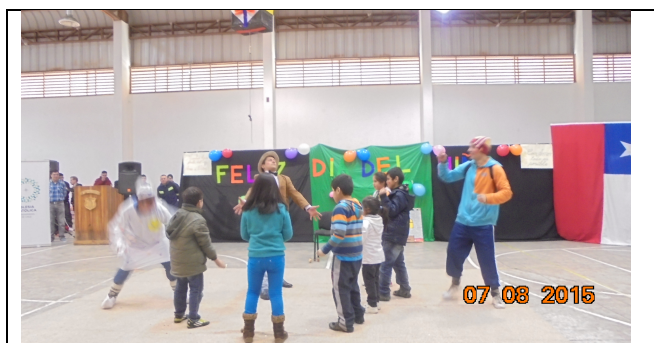
IMG. N° 001 Reinserción Social: Sub Programa Deporte, Recreación, Arte y Cultura, EP. Puerto Montt.

En el marco de la celebración del día internacional del niño, internos pertenecientes al módulo 53 y 54 del Establecimiento Penitenciario de Puerto Montt, organizan actividad consistente en obra de teatro, contando con la presencia de 26 niños y niñas hijos de los internos a modo de generar un espacio en el que se pueda compartir un momento grato en familia.